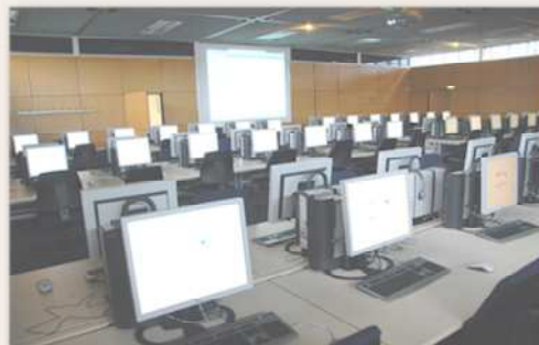
Testcenter Universität Bremen